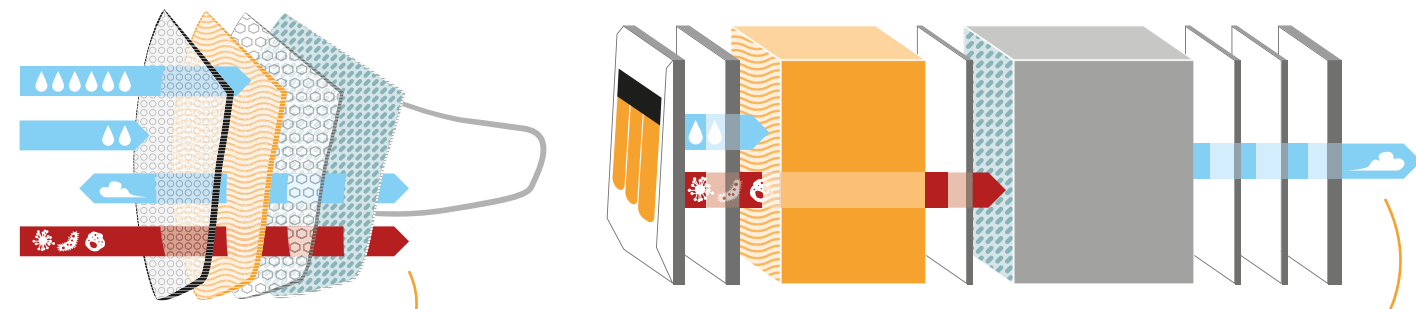
Masque chirurgical Perméabilité d'un masque chirurgical aux germes et particules