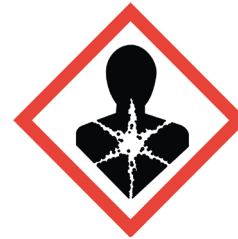
Risque pour la santé